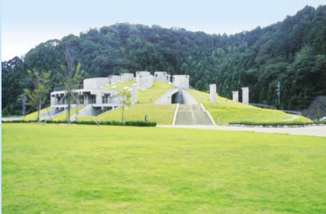
三方町縄文博物館（三方町鳥浜）

平成12年4月、縄文をテーマに三方町がつくった博物館で、環境考古学の視点による展示も設けられ、この町から縄文に関するいろいろな情報を発信し、縄文を基点としたまちづくりをしようとするための施設です。